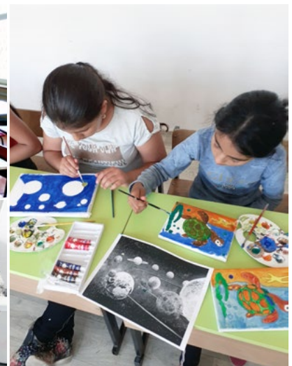
Nach dem Lockdown: An der Otez-Paisij-Schule haben die Jüngsten der STEP-IN-Gruppe hochmotiviert einen alten Schreibtisch kunstvoll modernisiert (unten) und auf Leinwand gezeichnet (rechts).