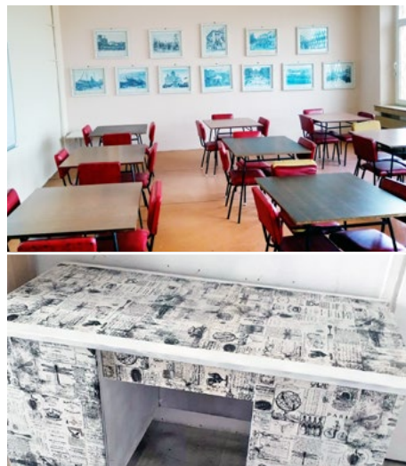
Während des Lockdowns hat das Lehrpersonal an der Dobri-Voinikov-Schule mit Mitteln des BDS-Freundeskreises die Kantine gestrichen. Außerdem wurde ein Warmwasserboiler installiert (oben).