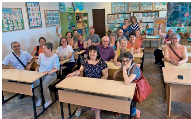
Highlight Bulgarienreise des BDS-Freundekreises: In der Otez Paisi Schule in Maksuda (Varna) drückte die Reisegruppe nochmals die Schulbank und lernte das vom Freundeskreis geförderte Bildungsprogramm STEP IN sowie die vom Freundeskreis angestoßene Lern- und Spielgruppe kennen.