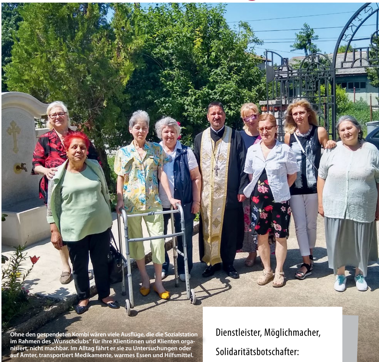
Ohne den gespendeten Kombi wären viele Ausflüge, die die Sozialstation im Rahmen des „Wunschclubs“ für ihre Klientinnen und Klienten organisiert, nicht machbar. Im Alltag fährt er sie zu Untersuchungen oder auf Ämter, transportiert Medikamente, warmes Essen und Hilfsmittel.

Dienstleister, Möglichmacher, Solidaritätsbotschafter: Ein Kombi, vor acht Jahren als Spende persönlich überbracht, bewegt die Menschen der Sozialstation. Seite 3