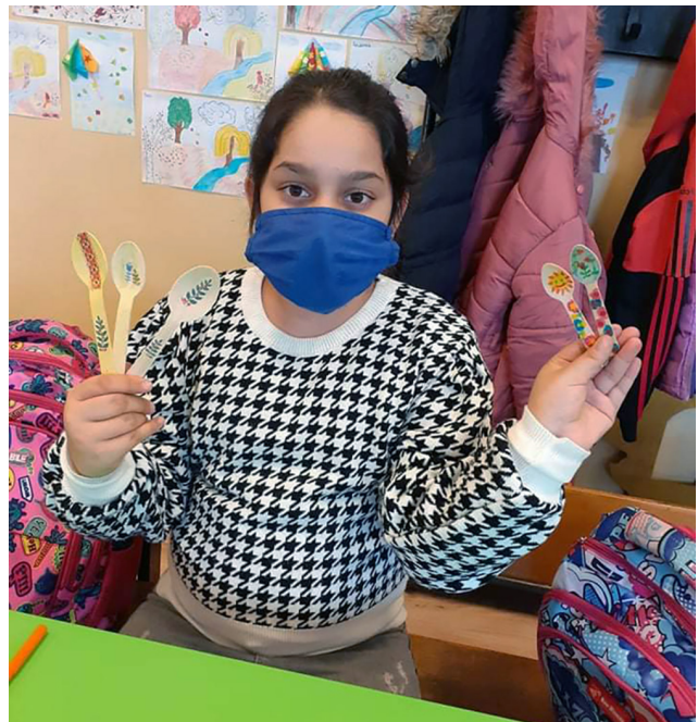
Selbst gestaltet: Stolz zeigt eine Schülerin eine Arbeit aus dem schulergänzenden Bildungsprojekt STEP IN. Seit 2006 übernehmen die Kommune Varna und der Freundeskreis des BDS die Finanzierung von STEP IN an der Otez Paisij Schule im Varnaer Stadtteil Maksuda. Im Jahr darauf startete das Bildungsprojekt auch an der Dobri-Voinikov-Schule in Kamenar.